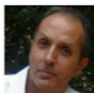
Архитектор Filippo Bombace Рим

Создавая проект этой квартиры, дизайнер держал в уме сложную конфигурацию здания, в котором она находится. Дом в постройки 1970-х годов имеет множество балконов полукруглой формы, буквально облепивших его, – в то время это было прогрессивно и, очевидно, модно. Игнорировать своеобразие архитектуры автор проекта не стал, наоборот, решил, что геометрическая последовательность прямой линии, полукруга и четверти круга станет основой планировки квартиры и в эту концепцию впишутся и внутренние многочисленные перегородки, и вся мебель по форме. После того как была определена схема распределения пространства по этому геометрическому принципу, началась работа над выбором материала и определением его цвета. В итоге были выбраны дубовая древесина для мебели, панелей, систем хранения, полов и перегородок и белый цвет